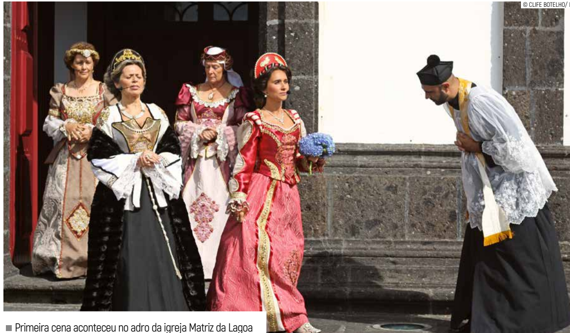
■ Primeira cena aconteceu no adro da igreja Matriz da Lagoa