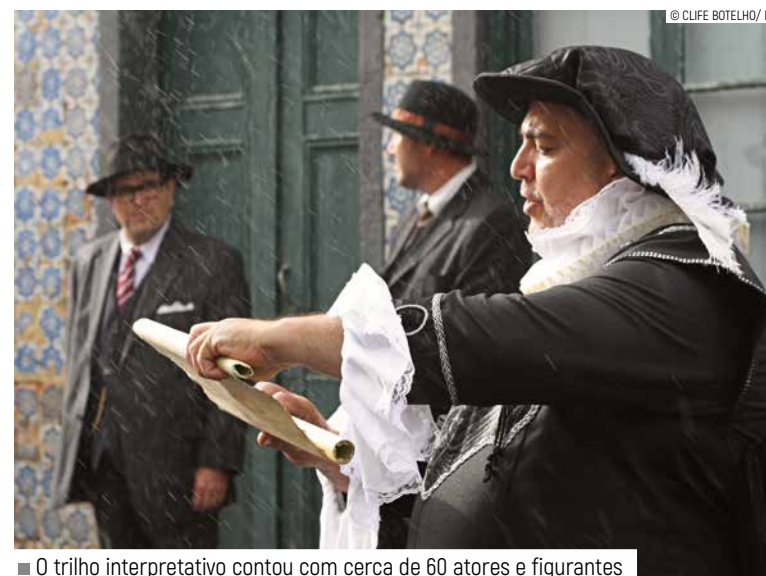
■ O trilho interpretativo contou com cerca de 60 atores e figurantes

“Gostei muito. Foi uma recriação histórica que nos permitiu