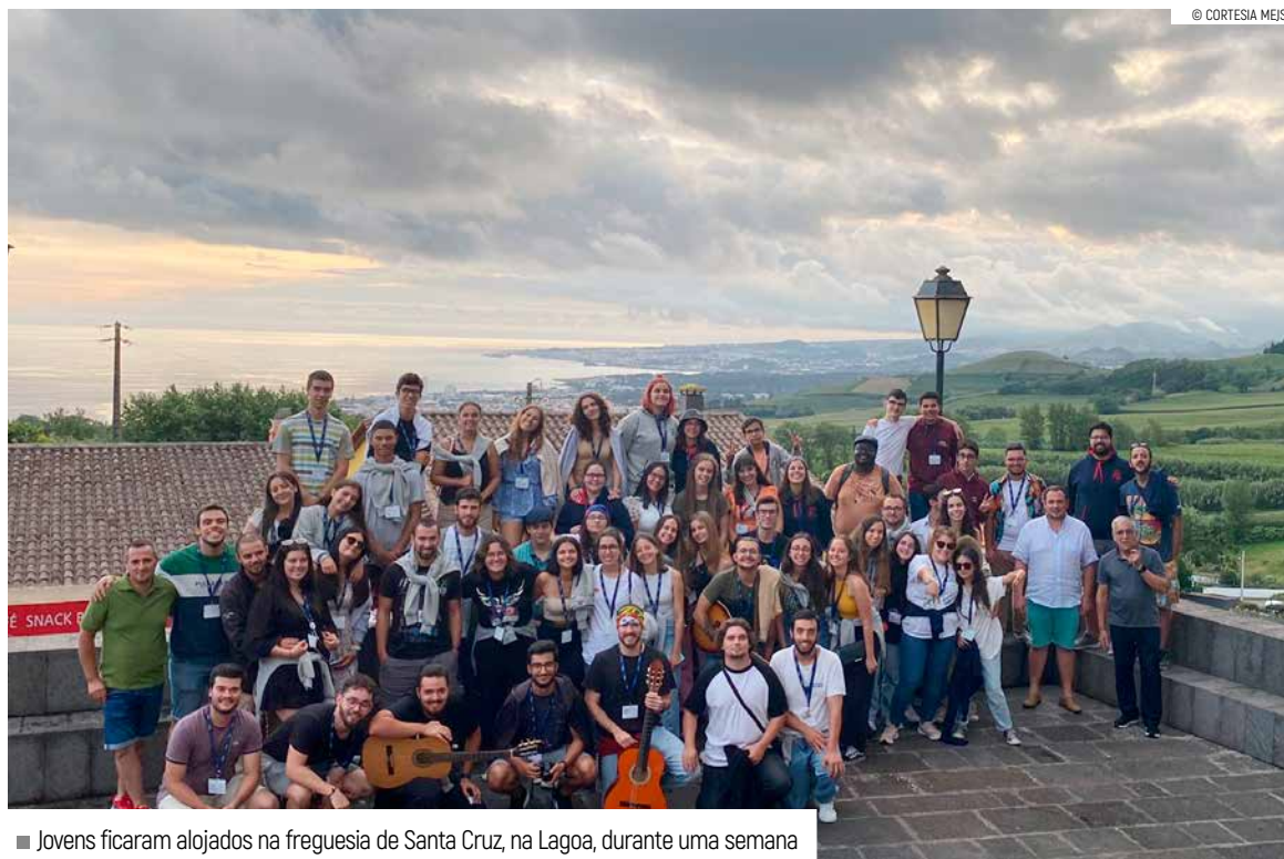
■ Jovens ficaram alojados na freguesia de Santa Cruz, na Lagoa, durante uma semana