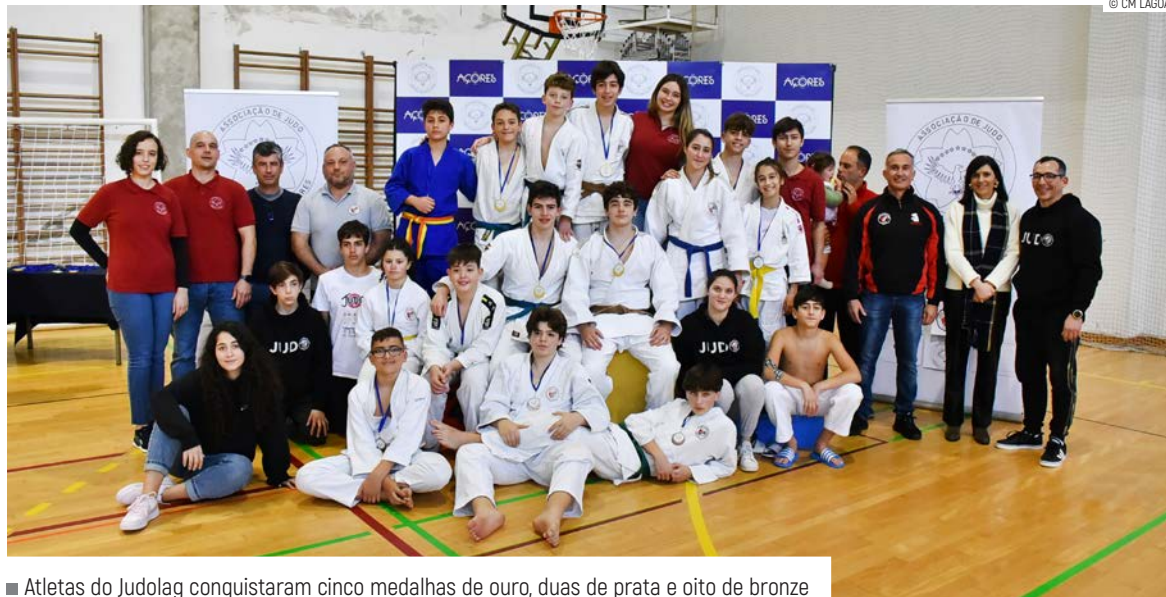
■ Atletas do Judolag conquistaram cinco medalhas de ouro, duas de prata e oito de bronze