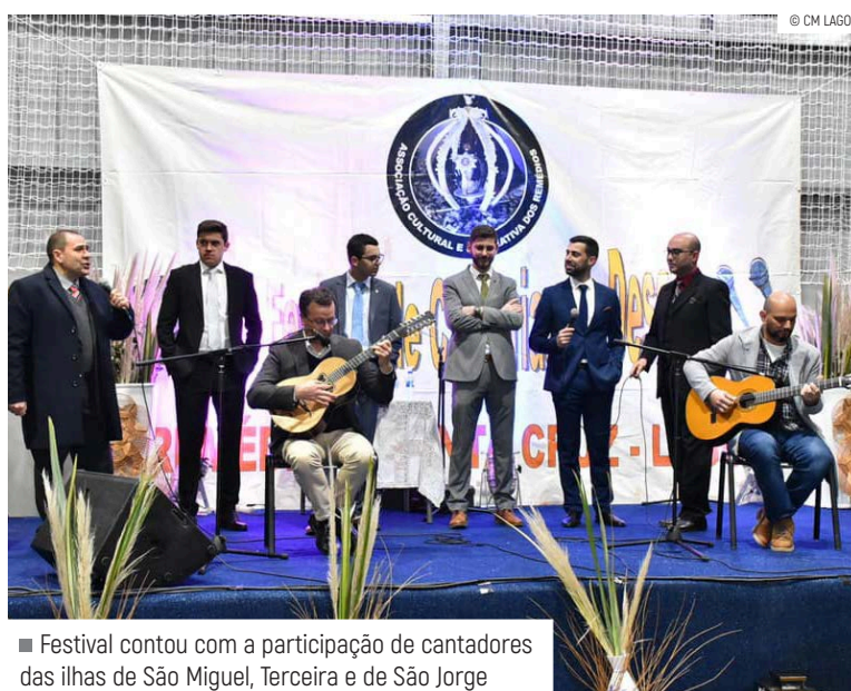
■ Festival contou com a participação de cantadores das ilhas de São Miguel, Terceira e de São Jorge

Depois de uma pausa imposta pela pandemia, o festival mais famoso do lugar dos Remédios voltou a realizar-se e numa nova casa: o novo pavilhão Professor Jorge Amaral. Decorreu no fim de semana de 10 a 12 de fevereiro a 17ª edição do Festival de Cantorias ao Desafio, e foi, como habitualmente promovido pela Associação Cultural e Recreativa dos Remédios,