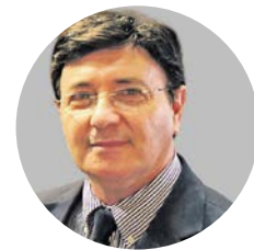
■ Por Roberto Medeiros