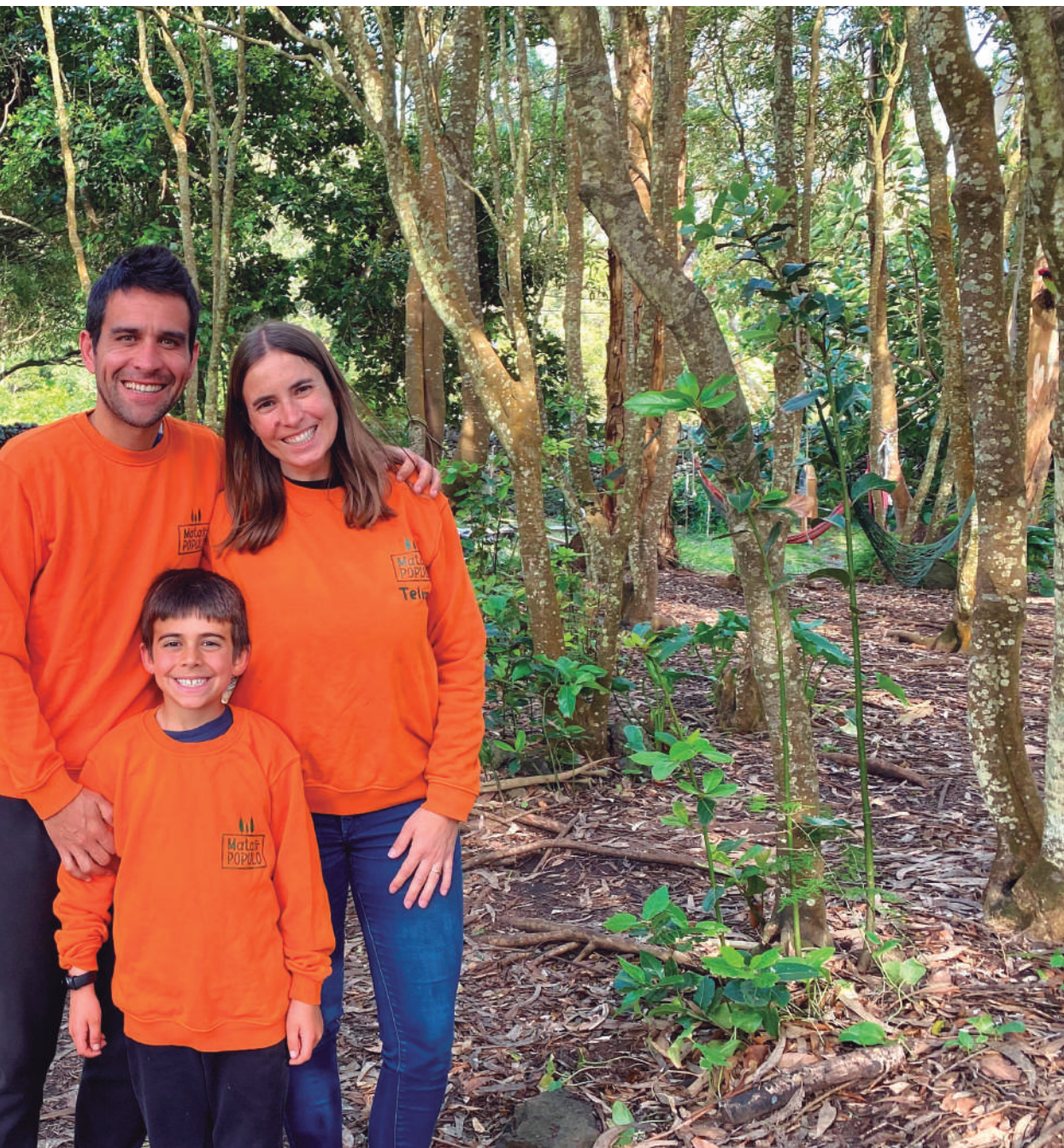
da Mata do Póculo

contacto com a natureza, num ambiente “seguro e estimulante”. Os playgroups são um dos principais programas da mata e, organizados em sessões temáticas de cerca de duas horas, incluem um exercício de “conexão com os pássaros e com as árvores”, jogos tradicionais, mexer na terra, subir às árvores, construir e criar através da imagina-