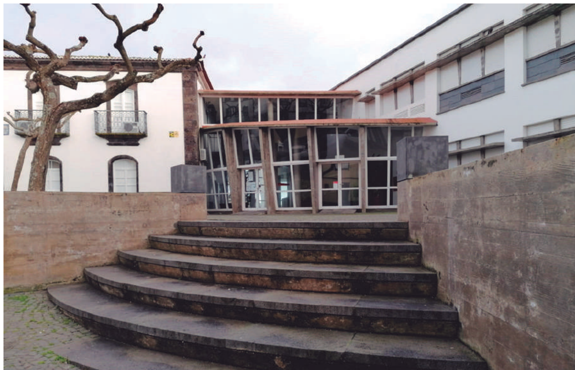
Deixa de ser possível gravar som e imagem nas reuniões públicas da câmara da Lagoa

ser uma tentativa de deslegitimar o recurso a fontes confidenciais e as restrições introduzidas pelo novo regulamento, a direção do Diário da Lagoa formalizou uma exposição junto da Associação Portuguesa de Imprensa (API) e avançou com uma participação formal à Comissão da Carteira Profissional de Jornalista (CCPJ).