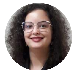
Por Micaela Pimentel Jurista

E talvez seja isso que eu mais desejo que os leitores levem deste livro: a certeza de que sentir nunca será uma fraqueza. Sentir é aquilo que nos mantém humanos.