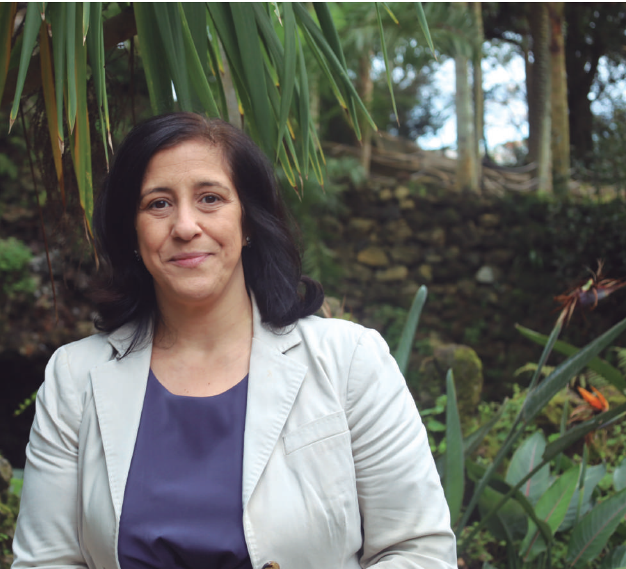
Movimento independente Ponta Delgada para Todos

movimento, temos pessoas oriundas de diversos partidos e outras sem filiação partidária. Esta é a riqueza da humanidade: sermos capazes de estar na mesma sala, com ideologias diferentes, mas com o objetivo comum de melhorar Ponta Delgada e as condições de vida dos seus habitantes. Fazemos questão de demonstrar que não estamos contra os partidos ou as suas ideologias, mas sim a favor de soluções que melhorem a vida das pessoas. Os cidadãos veem nisso uma esperança e sabem